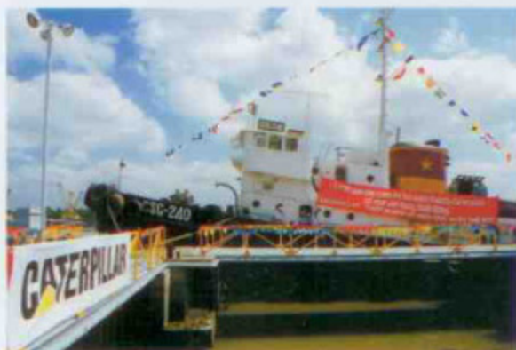
Caterpillar sea equipment on display at an exhibition in Sai Gon Port.