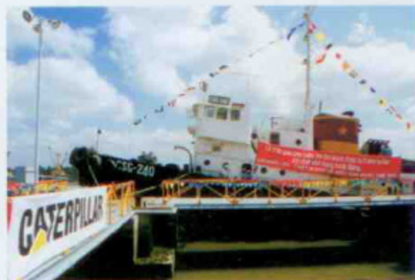
Thiết bị biển Caterpillar tại một cuộc trưng bày ở cảng Sài Gòn.